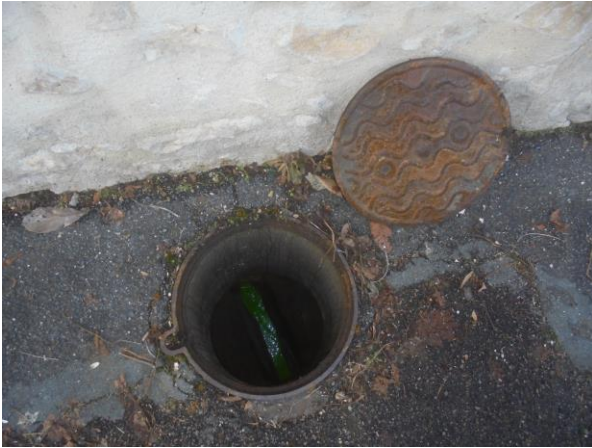
Boîte de Branchement EP, sur le Domaine Public Rue des Mariniers, avec le fluo en provenance de la Gouttière (commune à la Copropriété)