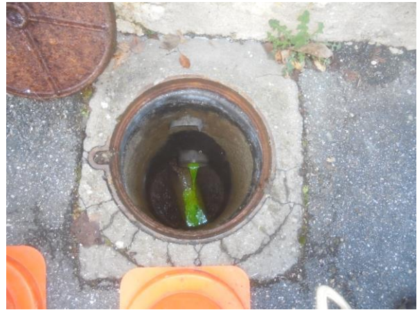
Boîte de Branchement EU, sur le Domaine Public Rue des Mariniers, avec le fluo en provenance des EU de la Maison