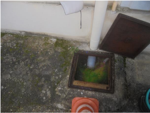
Regard Intermédiaire EU, sur le Domaine Privé avec le fluo en provenance des EU de la Maison