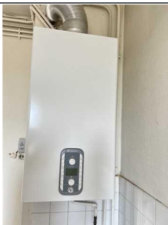
Photo n° PhGaz001 Localisation : Cuisine Chaudière (Type : Raccordé)