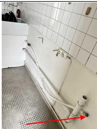
Photo n° PhGaz003 8b : l'extrémité de l'organe de coupure d'appareil ou de la tuyauterie en attente n'est pas obturée. (Cuisine) L'extrémité de la tuyauterie en attente n'est pas obturée; Poser ou faire poser un bouchon par un installateur gaz qualifié sur l'extrémité de la tuyauterie