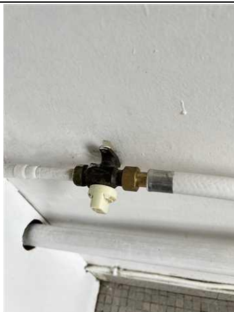
Photo n° PhGaz002 Localisation : Cuisine Robinet en attente (Type : )