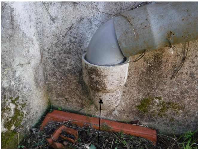
ABORDS (mur extérieur du WC 1) : Embase conduit de ventilation en coude amiante ciment.