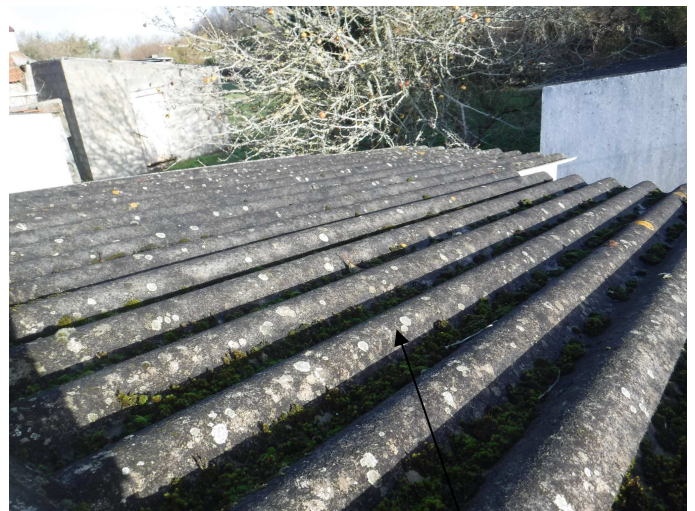
GARAGE et LOCAL POMPE A EAU : Couvertures en plaques ondulées amiante ciment.