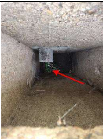
Photo n° PhAss001 Localisation : Généralités Description : Méthode de contrôle : Colorant