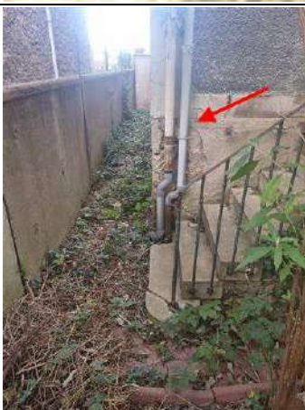
Photo n° PhAss002 Localisation : Eau Pluviales : Description : Gouttière arrière/rue : Rejet dans les eaux usées